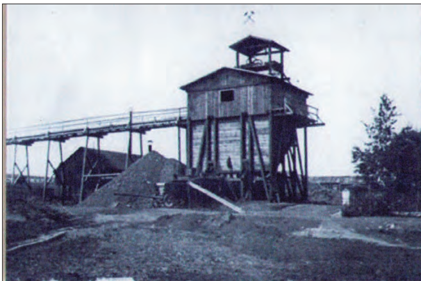
Těžní věž u Chobota