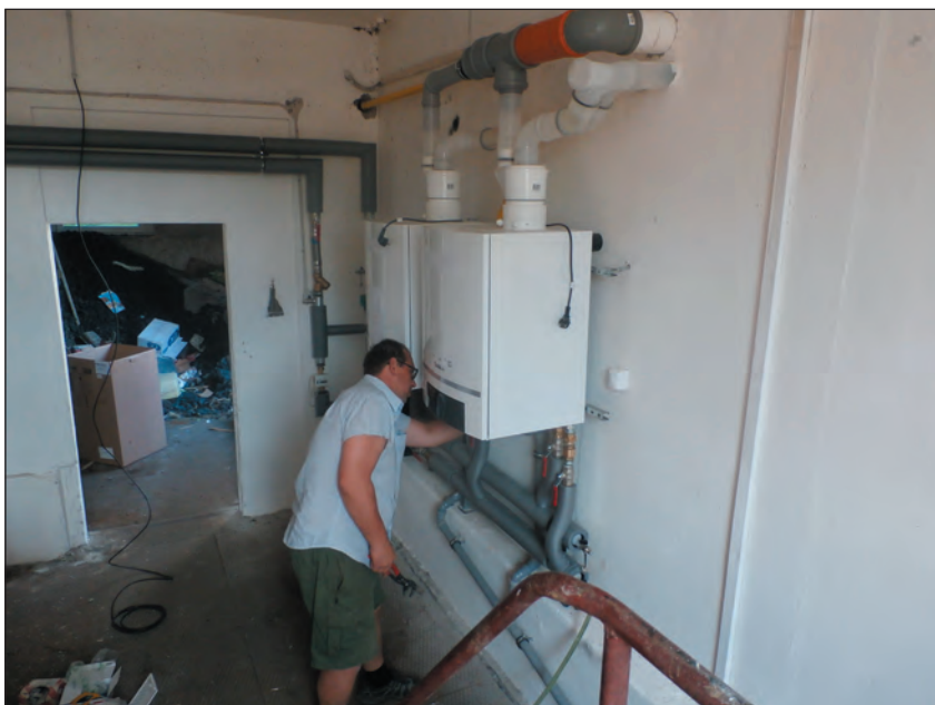
Oprava plynové kotelny