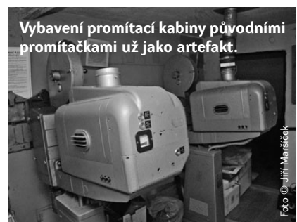
Vybavení promítací kabiny původními promítačkami už jako artefakt.