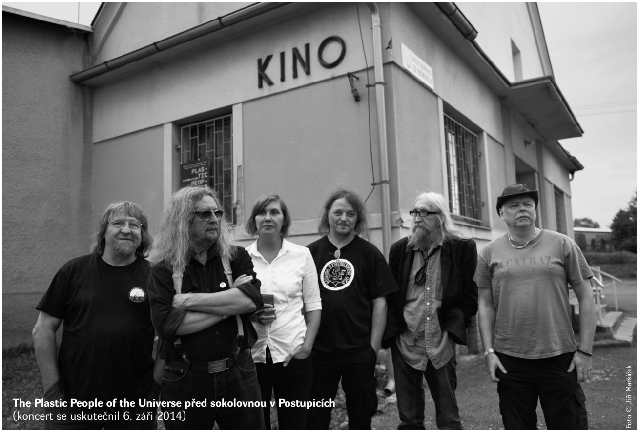
The Plastic People of the Universe před sokolovnou v Postupicích (koncert se uskutečnil 6. září 2014)

Buchov • Dobříčkov • Čelivo • Holčovice • Jemniště • Lhota Veselka • Lísek • Milovanice Miroslav • Mokliny • Nová Ves • Postupice • Pozov • Roubíčková Lhota • Sušice • Vrbětín