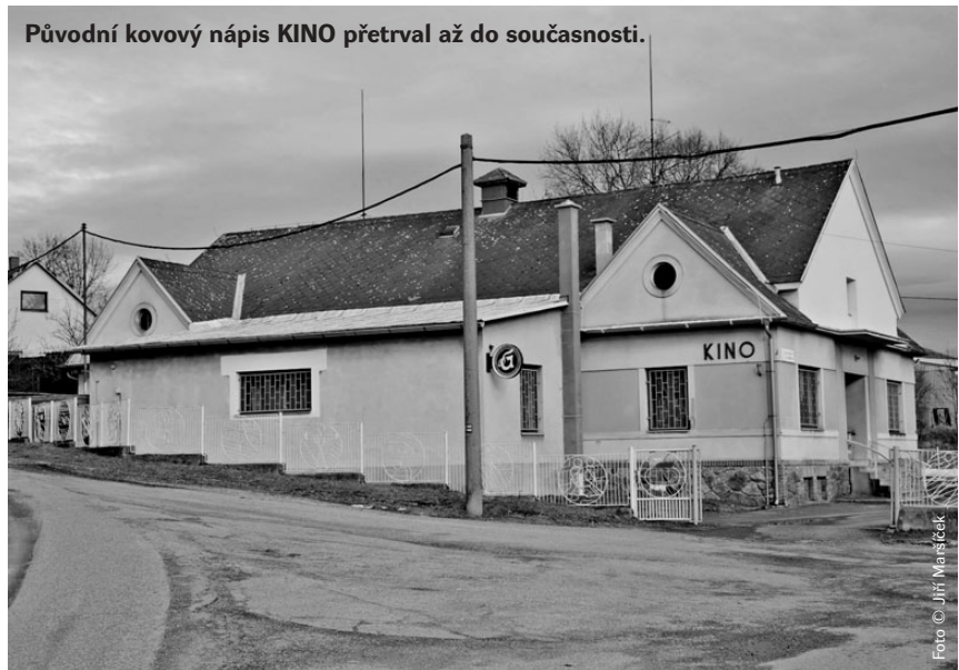
Původní kovový nápis KINO přetrval až do současnosti.