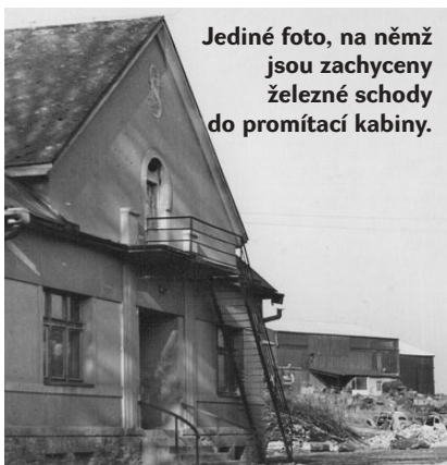
Jediné foto, na němž jsou zachyceny železné schody do promítací kabiny.