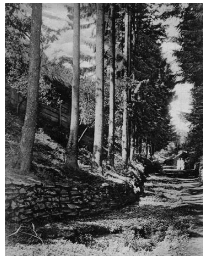
Na Průhoně – úvozová cesta do Pozova mezi domy čp. 26 a 27, kterou obecní pasák proháněl dobytek na společné pastviště Na Bejkovku.