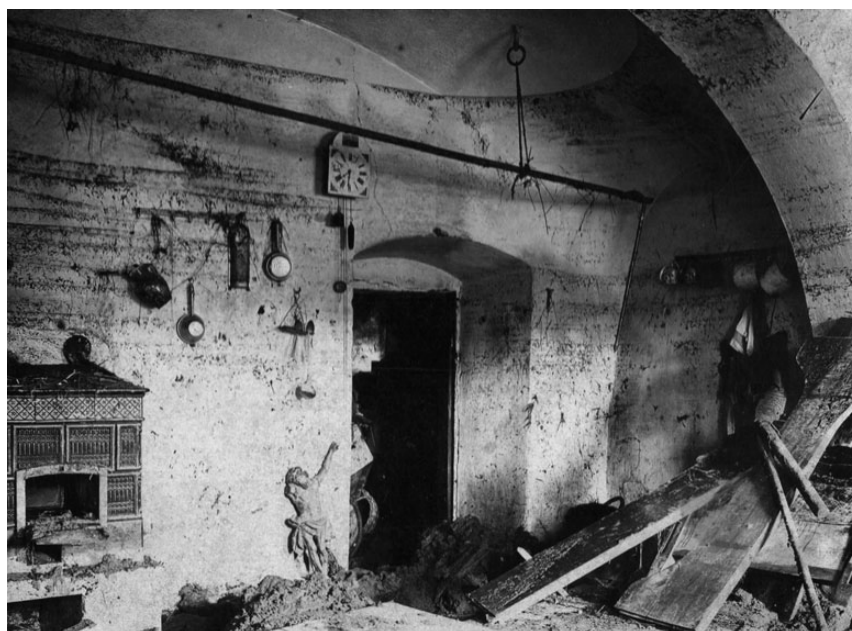
Paurův mlýn po povodni. Na fotografii je vidět, kam až sahala voda a kruh u stropu, kde se držel kočí Málek.

Zhoubna hnala se bleskurychle k dolejšímu rybníku a k Paurovu