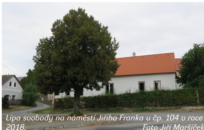
Lípa svobody na náměstí Jiřího Franka u čp. 104 v roce 2018.