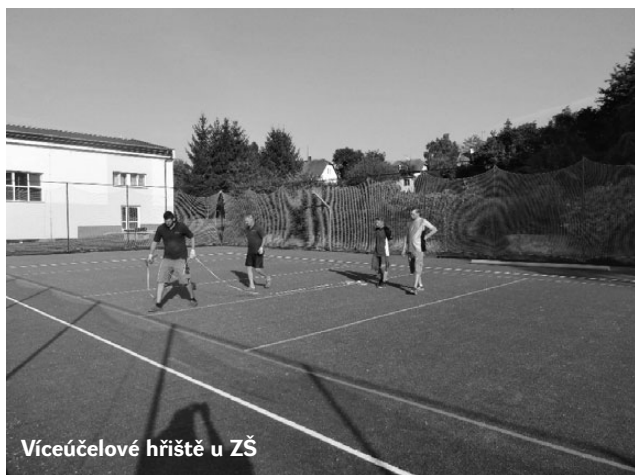
Víceúčelové hřiště u ZŠ