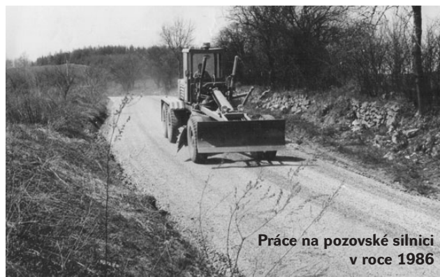
Práce na pozovské silnici v roce 1986