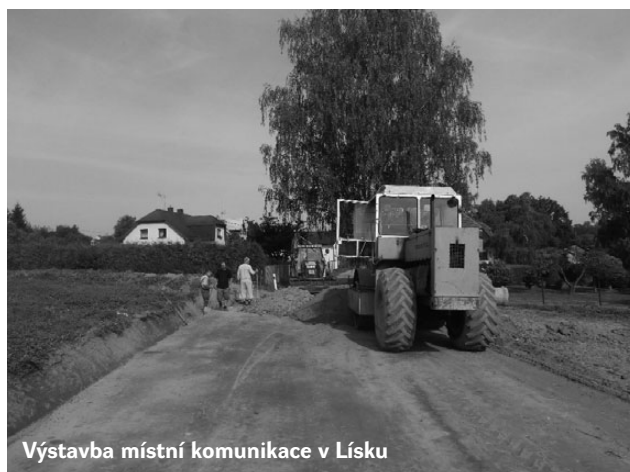
Výstavba místní komunikace v Lísku