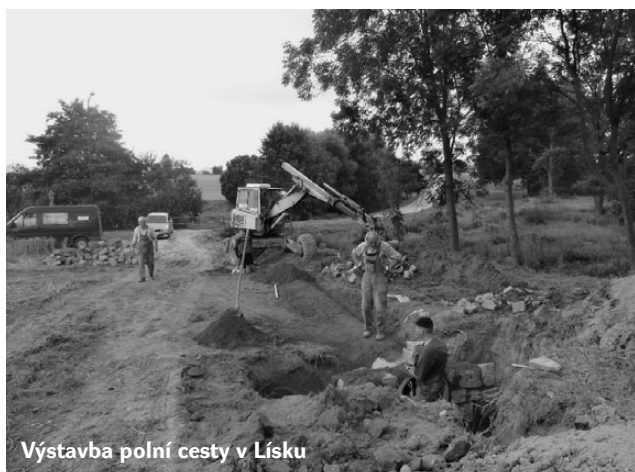
Výstavba polní cesty v Lísku