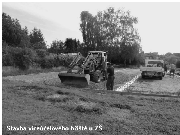
Stavba víceúčelového hřiště u ZŠ