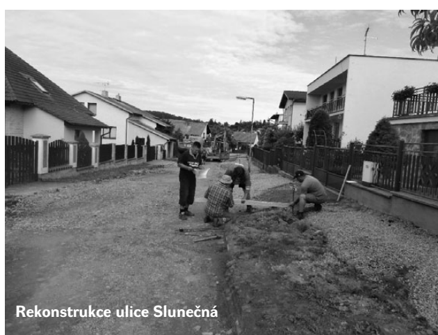
Rekonstrukce ulice Slunečná