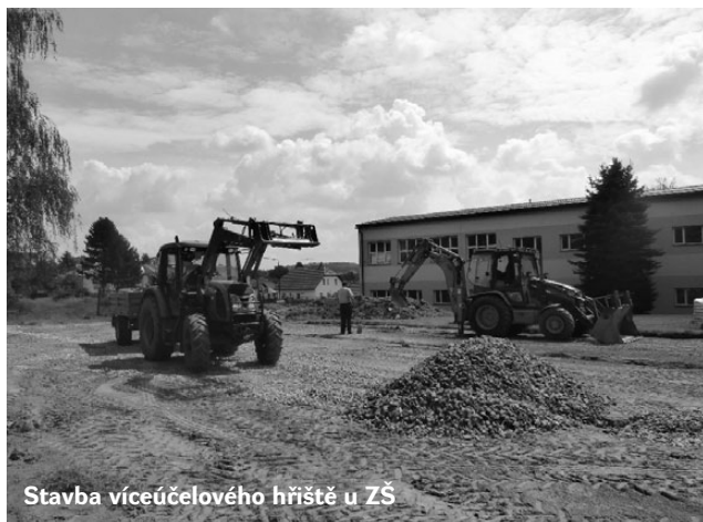
Stavba víceúčelového hřiště u ZŠ

Další dokončenou akcí je oprava povrchu komunikace z Postupic do Pozova. Bylo zde vyřešeno i uvývání spodní vody oddre-