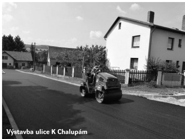
Výstavba ulice K Chalupám

názováním. Vybudováním nového propustku a silničních vpustí je řešeno odvádění přívalových srážek na okraji osady Pozov.