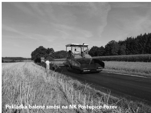
Pokládka balené směsi na NK Postupice-Pozov