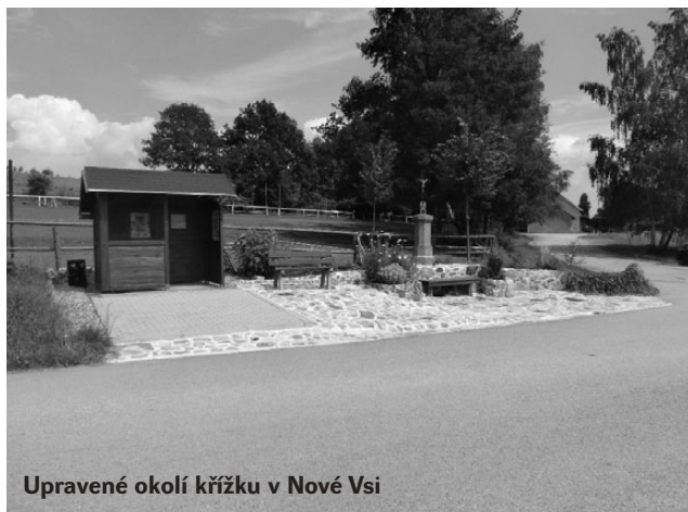
Upravené okolí křížku v Nové Vsi