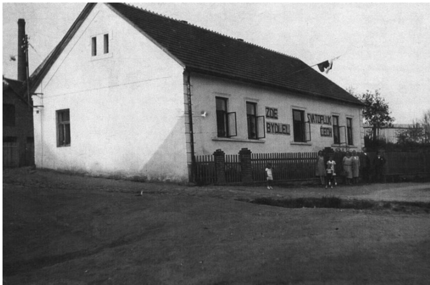
Foto z roku 1946, kdy se konaly oslavy stých narozenin Svatopluka Čecha v Postupicích.

Svatopluk Čech tuto zkušenost z dětství popsal ve své knize. Z dávných vzpomínek cituji: Byt mých stravovatelů se skládal z jedné světnice s okny proti hospodě a dílny vzađu. Zařízení světnice bylo prosté, pama-