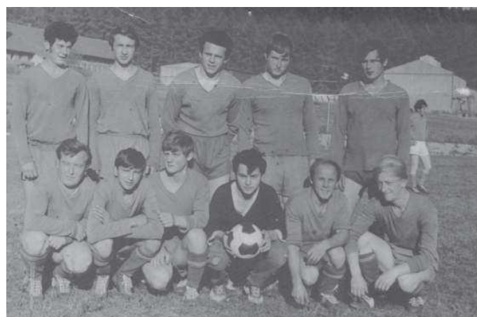
TJ Sokol Ostředek – rok 1969