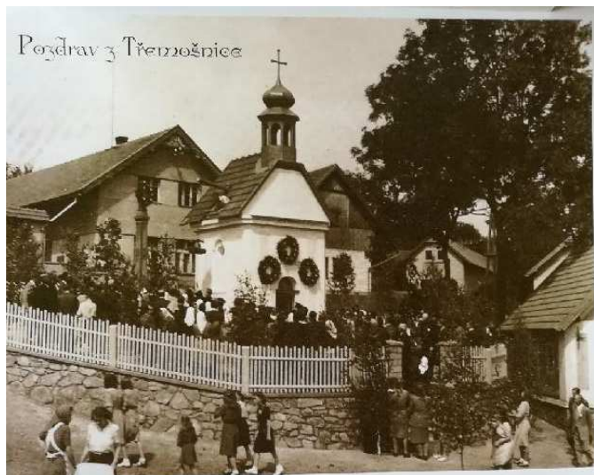
Pozdrav z Třemošnice

Váření rodáci, občané a přátelé Třemošnice,