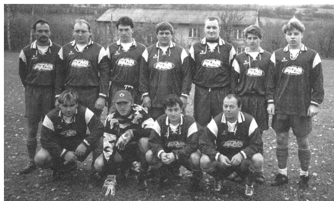
TJ Sokol Ostředek - konec 90 let