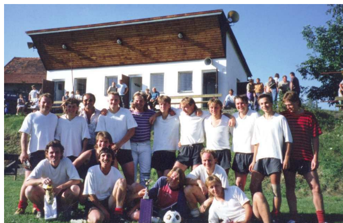
TJ Sokol Ostředek – srpen 1993