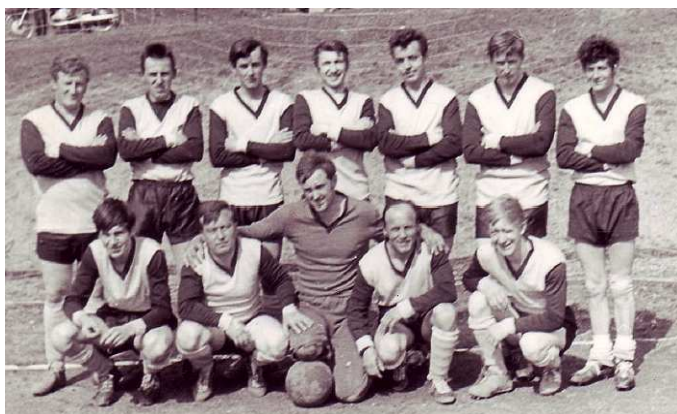
Tým ze sezony 1970/71

Vydává Obec Ostředek. Na zpravodaji spolupracovali: Mgr. Alena Měchurová, korektura Ing. Marek Škvor a další uvedení přispívající. V Ostředku dne 20. června 2017, číslo 2/2017. Náklad 200 výtisků. Vychází čtvrtletně. Za obsah zodpovídá Mgr. Alena Měchurová. Evidenční číslo zpravodaje MK ČR E 21132. www.ouostredok.cz .