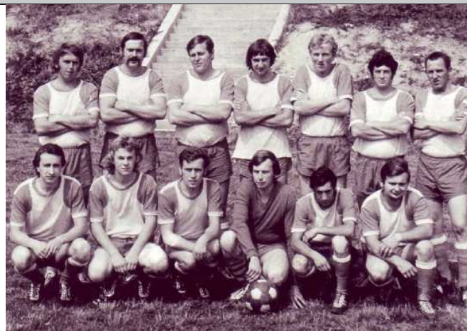
TJ Sokol Ostředek – srpen 1977