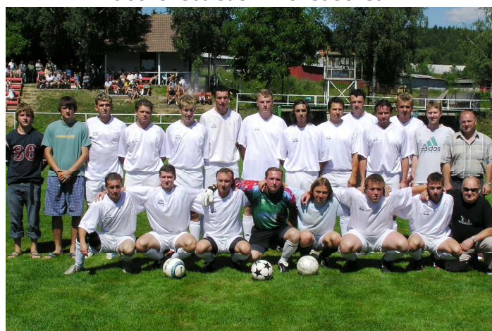
Nováček OP – červenec 2006