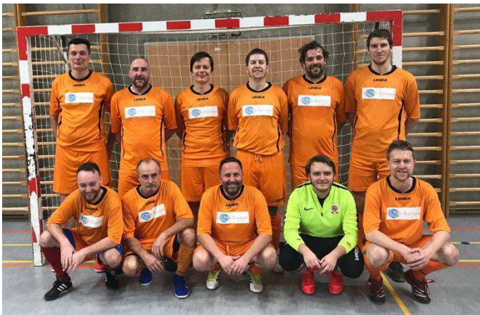
Předposlední únorový týden vyrazili ostřeďečtí fotbalisté na čtyřdenní soustředění do Jičína.