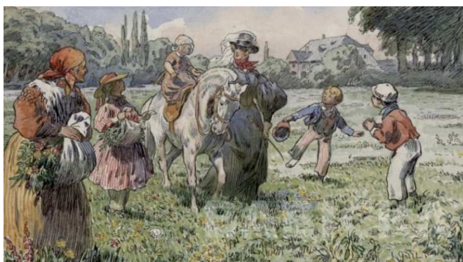
Ilustrace " Babičky " od Adolfa Kašpara z roku 1924