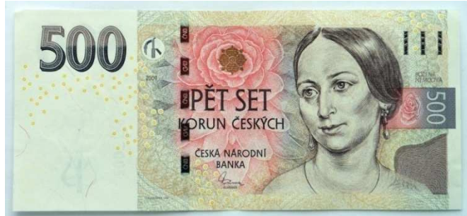
Božena Němcová - portrét a zobrazení na naší platné bankovce.