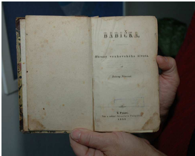
První vydání " Babičky " z roku 1855

Boženino nejznámější dílo Babička se dočkalo více než tři set českých vydání a bylo přeloženo do více než dvaceti jazyků, také se dočkalo několika filmových adaptací. Tou nejoblíbenější a nejvysílanější je stejnojmenný film z roku 1971, kde si hlavní roli moudré bělovlasé stařenky zahrála Jarmila Kurandová a Barunku tehdy šestnáctiletá Libuše Šafránková. Film se natáčel zejména v Ratibořicích, některé scény však pocházely z Opočna, Dobrušky či Nového Města nad Metují. Jako první se paradoxně natáčela poslední scéna, ve které Libuše Šafránková přichází říct včelíčkám, že je babička po smrti.