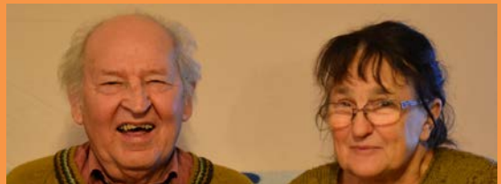
V červnu a srpnu oslavili svá jubilea

V neděli dopoledne vám v případě zájmu zajistíme převoz koláče do soutěžního stánku.