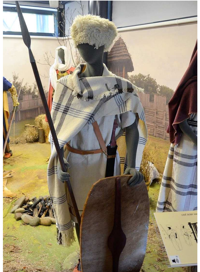
Tak nějak se oblékal kmen „BÓJŮ“.

3) od 5. století př. n. l. – Keltové - kmen Bójů, byli první, u nichž známe etnicitu a jazyk. Podle nich název „Boiohaemum později Bohemia“.