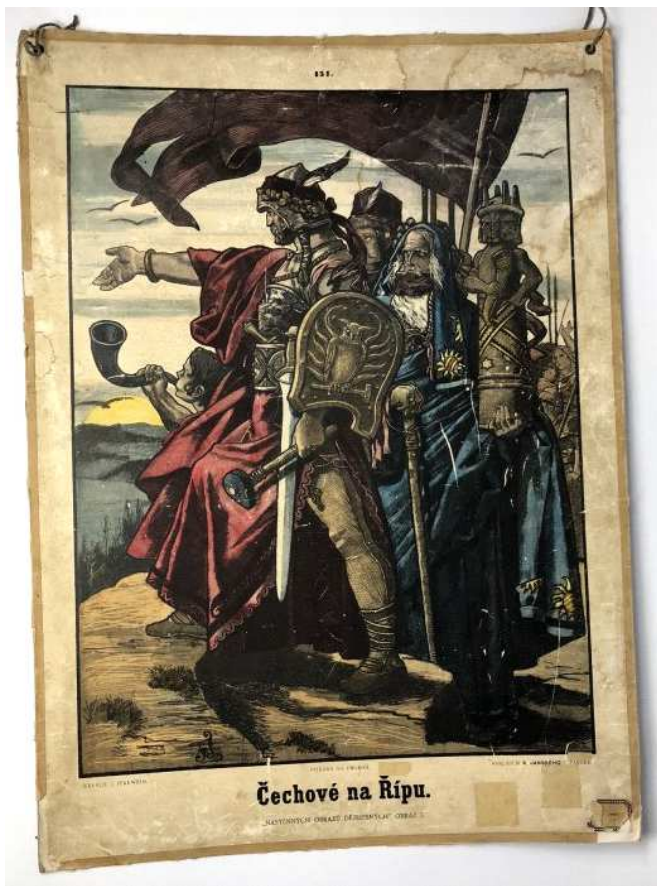
Školní obraz "Čechové na Řípu" v době pohanské.

7) 13. století - německá kolonizace. Na pozvání Přemyslovců se zde zabydlelo velké množství kolonistů z německých zemí, kteří zakládali vesnice, ale i městské čtvrti.