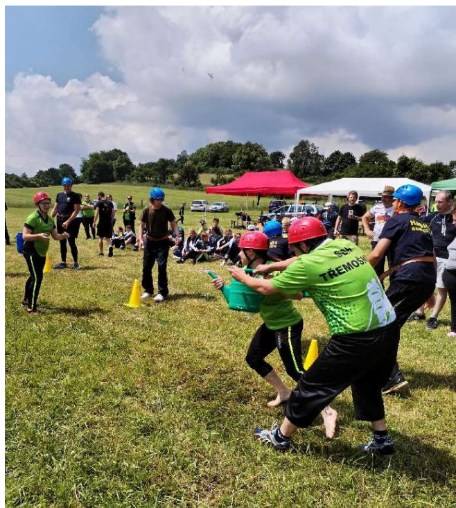
Kbelíková štafeta mezi domácí Třemošnicí a družstvem Samechova