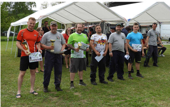
Pořadí muži: 1. Dalovy A, 2. Dalovy B, 3. Třemošnice, 4. Hvězdonic, 5. Třebešice, 6. Ostředek

Pak se sbor již intenzivně připravoval na hlavní domácí soutěž, kterou pořádáme od roku 2007. Přes dvouletý výpadek covidových ročníků 2020 a 2021 to letos byl již 15. ročník soutěže