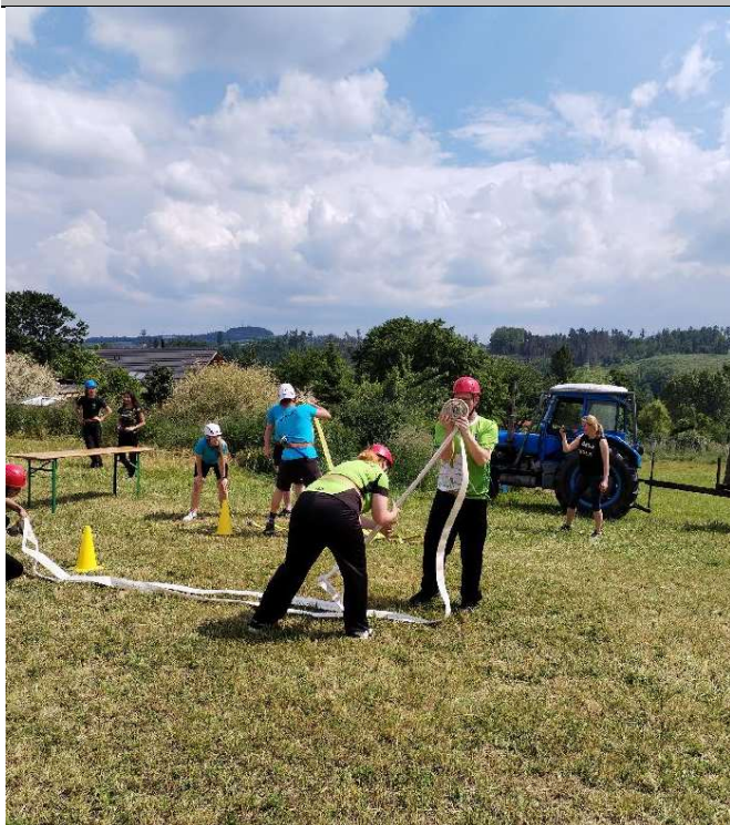
Souboj 2. družstva Třemošnice s borci z Ostředka při druhé štafetě

Výsledky dopadly následovně: na sedmém místě skončil tým Samechov ALL STARS s útokem 57,24 vteřiny a celkovým časem 7:00,15 minut, šesté místo obsadilo družstvo z Hvězdonice s útokem 47,00 vteřiny a celkovým časem 6:25,60 minut, pátý skončil Samechov 1 s útokem 41,93 vteřiny a celkovým časem 6:12,87 minut a čtvrté místo obsadilo družstvo Ostředek s útokem 40,35 vteřiny a celkovým časem 6:11,73 minut. Pro pohárová umístění si doběhlo na třetím místě družstvo Třemošnice A s útokem 34,25 vteřiny a celkovým časem 5:57,19 minut, před nimi na druhém stupínku skončil smíšený tým Samechov A s útokem 37,47 vteřiny a celkovým časem 5:55,99 minut a vítězné družstvo Třemošnice B mělo útok za 29,18 vteřiny a celkový čas 5:48,23 minut. Domáci tak obhájili putovní pohár z loňského roku. Celá soutěž se vydařila a všem se velice líbila.