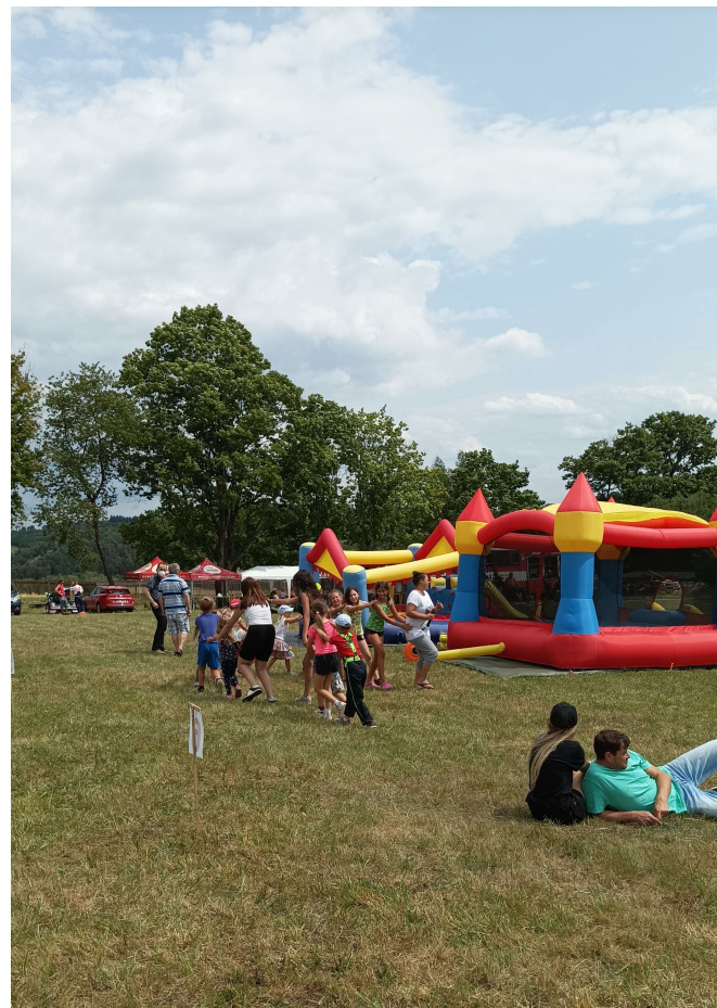
Dva hrady, kde se děti pěkně vyřádily

O týden později, 22. července, jsme zorganizovali druhý vrchol sezóny a sice „Hasičský dětský den“, na kterém měli největší podíl manželé Fehéroví, Jitka Veselá, a pak řada dalších pomocníků, neboť bylo vytvořeno 10 stanovišť s různými úkoly – 1. zatlukání hřebíků do dřeva, 2. požární slalom, 3. poznávačka puzzle – barvy a zvířátka, 4. stříkání džberovkou, 5. skládání TETRIS, 6. dojení krávy, 7. házení kroužků na cíl, 8. lovení rybiček, 9. sportování s NINJOU, 10. házení míčků na domeček. Do všech 10 úkolů se zapojilo 45 dětí a celkově se hasičského dětského dne zúčastnilo kolem 60 dětí. Mimo disciplíny byly v provozu dva dětské skákací hrady a na závěr samozřejmě i tradiční hasičská pěna. Organizačně se dětský den velice povedl, přálo nám i počasí a proběhla v rámci dne i soutěžní dětská diskotéka.