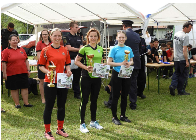
Pořadí ženy: 1. Dalovy, 2. Třemošnice, 3. Ostředek