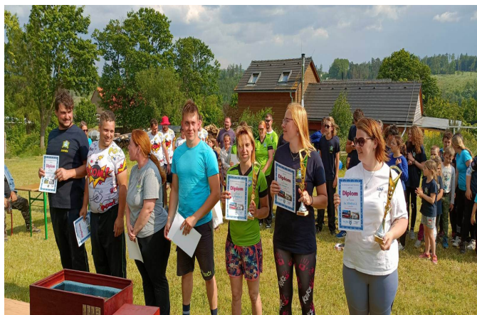
Vyhodnocení soutěže dospěláků

Výsledky dopadly následovně: na sedmém místě skončil tým Samechov ALL STARS s útokem 57,24 vteřiny a celkovým časem 7:00,15 minut, šesté místo obsadilo družstvo z Hvězdonice s útokem 47,00 vteřiny a celkovým časem 6:25,60 minut, pátý skončil Samechov 1 s útokem 41,93 vteřiny a celkovým časem 6:12,87 minut a čtvrté místo obsadilo družstvo Ostředek s útokem 40,35 vteřiny a celkovým časem 6:11,73 minut. Pro pohárová umístění si doběhlo na třetím místě družstvo Třemošnice A s útokem 34,25 vteřiny a celkovým časem 5:57,19 minut, před nimi na druhém stupínku skončil smíšený tým Samechov A s útokem 37,47 vteřiny a celkovým časem 5:55,99 minut a vítězné družstvo Třemošnice B mělo útok za 29,18 vteřiny a celkový čas 5:48,23 minut. Domáci tak obhájili putovní pohár z loňského roku. Celá soutěž se vydařila a všem se velice líbila.