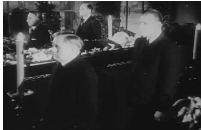
Pohřeb Jana Masaryka 13. března 1948 – proč již třetí den po smrti?

lidmi pro konečnou odpověď. Masaryk ale jakoukoli spolupráci odmítá a proto přichází na řadu plán B – jeho vražda alias „sebevražda“.