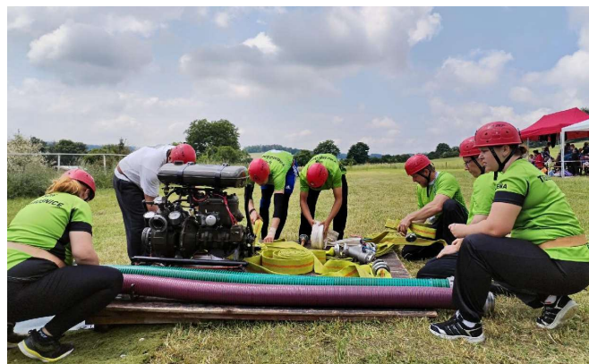
Domácí družstvo při přípravě útoku

nejslabších strojů PS 8 nazvaný „Třemošnická osmička“. Organizátoři opět připravili plochu „Na Vinici“ za velké pomoci SPZV, která zde sklídila travní porost. Díky patří i obci Ostředek za finanční podporu celé soutěže, mezi sponzory musíme vyzdvihnout firmu Bakker za poskytnutí ovoce pro zúčastněné, stejně jako SPZV Ostředek za klobásky a poděkování i SDH Hvězdonic za zapůjčení výčepní stoly na limonádu a pivo. V neposlední řadě bychom jménem výboru SDH chtěli poděkovat všem hasičům, kteří se aktivně zapojili do organizace akce. Letos jsme si pořídili i vlastní gril, takže nám odpadla jedna starost. Opět se soutěžilo o putovní poháry jak pro dětské kolektivy, tak pro smíšená družstva dospělých. V dětské kategorii bylo původně přihlášeno 6 družstev, Samechov nakonec přivezl jedno dětské družstvo. A výsledky: 1. Ostředek B s útokem 39,80 s a celkovým časem včetně obou štafet 5:32,40 minut, převzal zároveň putovní pohár od Hvězdonic, druhé místo obsadil Ostředek A s útokem 41,72 a celkovým časem 5:46,50 minut, na třetím stupínku skončily děti ze Samechova s útokem 33,91 a celkovým časem 5:49,79 minut, čtvrté a páté místo obsadily podstatně mladší děti z Hvězdonic s celkovými časy 10:28 a 12:17 minut. V kategorii dospělých mělo startovat devět družstev, bohužel nedorazily ale týmy z Dalov a Třebešic. I tak sedm družstev zahájilo opět nejdříve útoky, po nich pak následovala kbelíková štafeta a na závěr štafeta s hadicí a proudnicí.