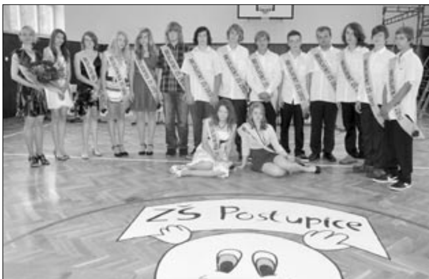
Zakončení školního roku a odcházející žáci.

Na doporučení jsem zkusila oslovit paní ředitelku v ZŠ Postupice a v tu chvíli jsem poprvé po dlouhé době pocítila, že někdo má zájem nejen o skvělé bezproblémové žáky, ale i o dítě, které je možná trochu „jiné“. Hned po vstupu do školy jsem cítila atmosféru místa, které je přátelské k dětem a jejich světu, což šlo poznat i z nástěnek a výzdoby a – teď se možná někdo