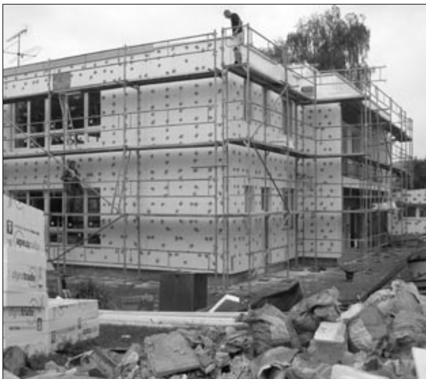
Zateplení na budově mateřské školy.

V současnosti se počty občanů naopak zvyšují. Roku 2000 žilo v Postupicích (575 + osady) celkem 1.106 občanů, narodilo se 8 dětí, z toho 5 chlapců a 3 dívky, zemřelo 12 osob, 7 sňatků, 3 rozvody, poslední přidělené čp. bylo 235.