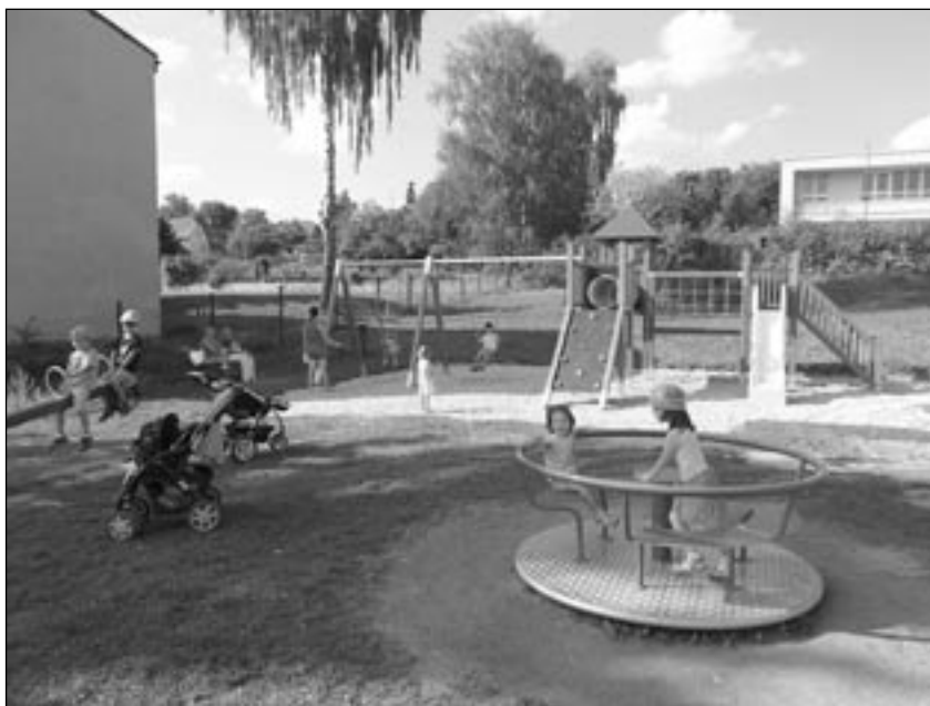
Nové dětské hřiště.

Tvořivé večery probíhají pravidelně v zimním období jednou měsíčně