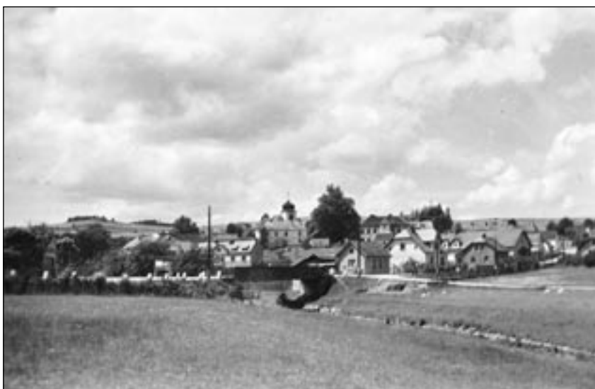
Foto z r. 1950, kde je zachycen železný most postavený po povodni.

Letošní léto připravilo našim motoristům problémy při stavbě nového mostu přes Chotýšanku směrem na Milovanice. Zbouraný starý most nahradil provizorní.